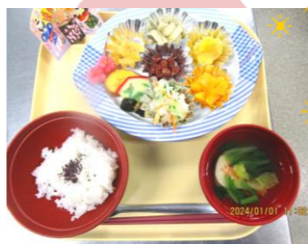
ゆかりご飯 雑煮 伊達巻き なます 伊達巻き 絵馬かま 数の子 黒豆栗きんとん ごま酢和え 果物