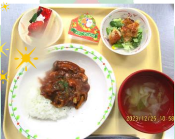
ハッシュドビーフ ダ スープ ミックサ ラ