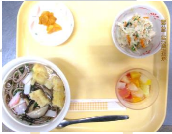
天ぷらそば 漬け物