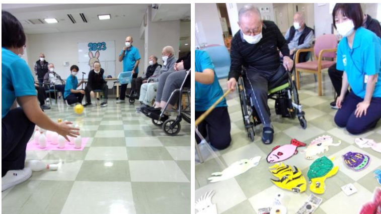
感染対策で中止していたゲームを再開しました。魚釣りやボーリング等、久しぶりな方も初めての方も皆様夢中になって参加されていました。