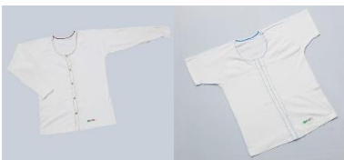
肌着(長袖・半袖) ※男女兼用