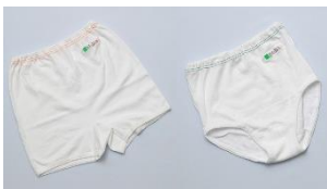
女性用 (ショーツ・スロース)