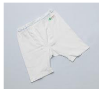
男性用 (ホクサーパンツ)